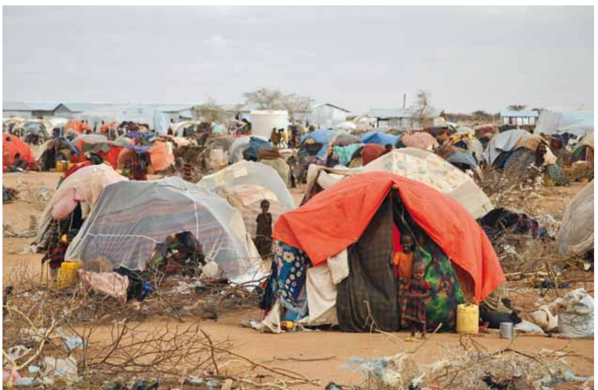
Eines der Lager im Norden Kenias, in dem Flüchtlinge aus Somalia leben.

»Jugend Eine Welt«, eine Organisation der Salesianer Don Boscos, betreut unter anderem ein Flüchtlingslager in Kakuma im Norden Kenias. Es liegt in einem der heißesten und trockensten